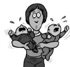
" à votre disposition "

Optymo : d'une façon générale, tout changement dans les habitudes est porteur de désagréments et ce d'autant plus que l'on n'y est pas préparé.