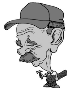
" une continuité d'actions "

Comme on peut donc le voir en examinant la réalité des opérations, la municipalité ne s'est certainement pas focalisée sur les effets d'annonce, souvent propres aux projets sans lendemain, mais sur une programmation de travaux fondée sur une continuité d'actions soigneusement étudiées et programmées en fonction des besoins majeurs et bien entendu des moyens de la commune.