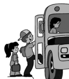
" correspondance "

Rappelons alors , à toutes fins utiles, que l'arrêt de l'aérodrome marque une correspondance entre les bus urbains qui arrivent jusque là au rythme de un toutes les 20 minutes et les autobus suburbains de la ligne de Giromagny qui ne circulent (pour l'instant) qu'au rythme de un par heure. De même, lorsque l'on utilise la ligne urbaine numéro 3, on dispose d'une cadence d'un bus toutes les dix minutes jusqu'à Valdoie, mais seulement un sur deux vous