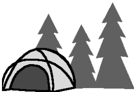
" vissematente "