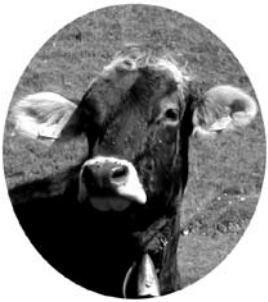
" ambiance festive "