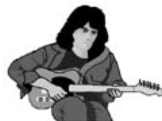
"concert de MISTA PAWA"