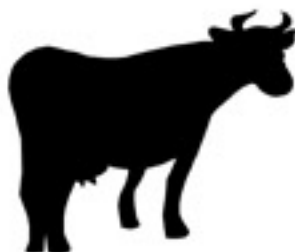
" passage du troupeau à 9H30 "