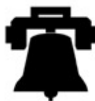
" 3 sonneries "

et 465 soumises à une circulation notable ; elles sont notamment empruntées par des camions citernes provenant de l'usine SOFRALU d'Auxelles-Bas et qui contiennent de l'aluminium en fusion (circuit indiqué en gras sur la carte qui précède). Outre le danger de brûlure par le métal en fusion, celui-ci peut conduire à des explosions s'il entre en contact avec de l'eau.