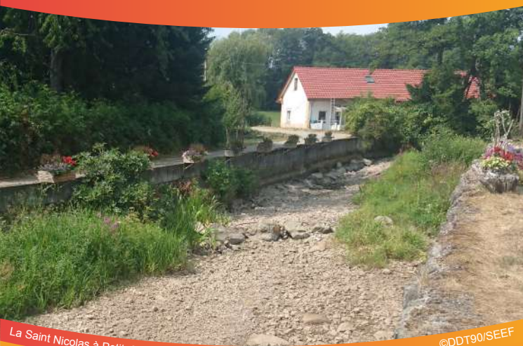
La Saint Nicolas à Petitefontaine le 01/08/18

Économiser l'eau, c'est protéger la ressource mais c'est aussi réduire ses dépenses