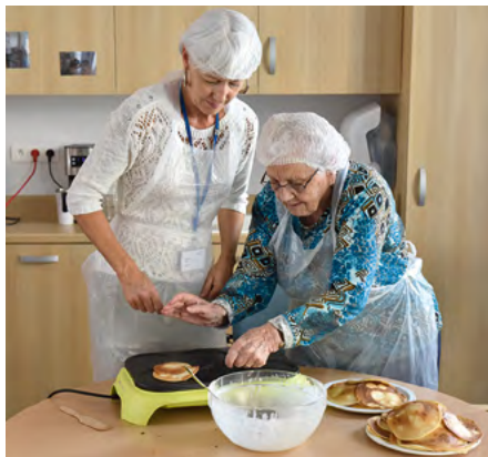
Accueil de jour au Chênois