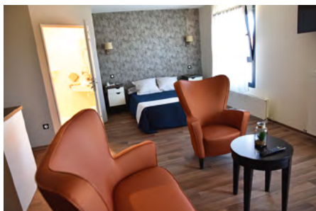
Résidence Pierre Bonafé à Belfort

> Pour tout renseignement, rendez-vous sur le site viatrajectoire.fr pour connaître la liste des Établissements d'Hébergement pour Personnes Âgées Dépendantes (EHPAD) ou Maison de l'autonomie : 03 70 04 89 00