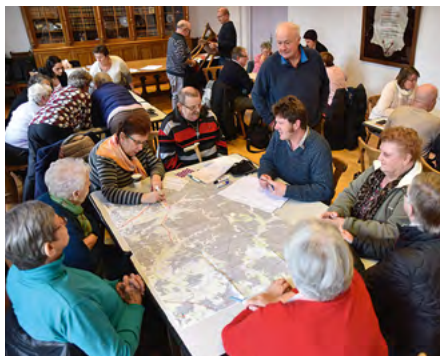
Atelier mobilité à Giromagny