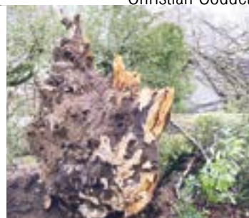
Le hêtre pourpre en février