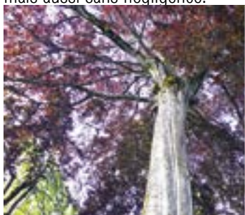
Le hêtre pourpre à l'automne