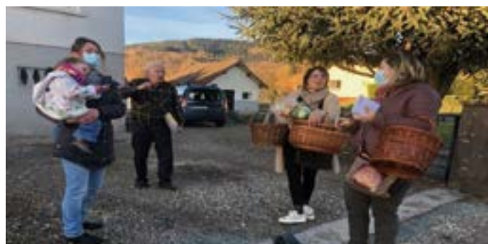
Distribution de bons d'achat aux anciens