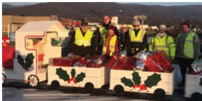
Mise en place des décorations de fin d'année