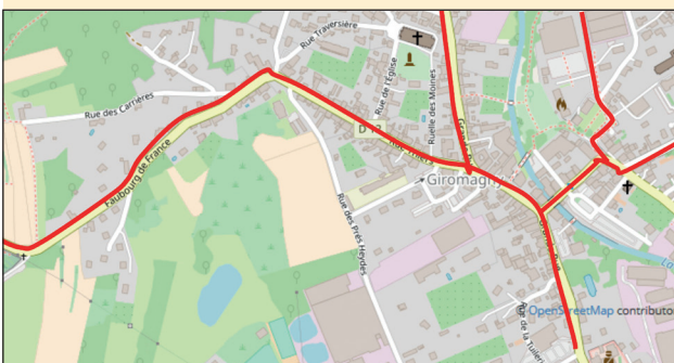
Les zones 30 à Giromagny