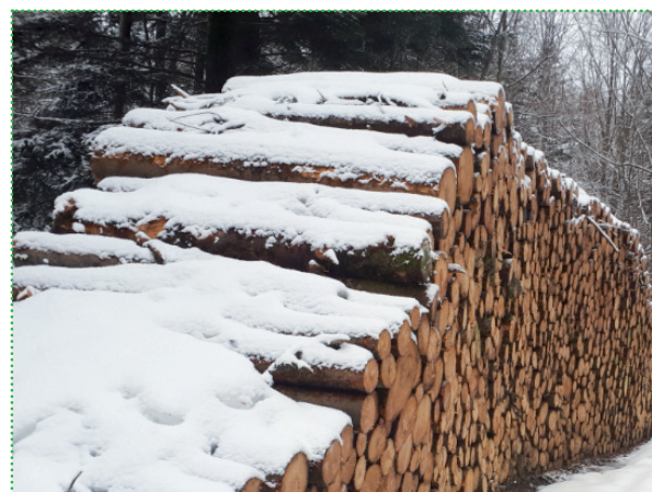
Les bois des parcelles 15 et 16 au Phanitor, prêts à quitter notre forêt.

Chaque année sur proposition de l'ONF, le conseil municipal décide du mode de vente des bois qui seront exploités dans la forêt communale. L'assiette des coupes est définie par notre document d'aménagement forestier établi pour la période 2009-2028. Cet aménagement programme les coupes et les travaux sylvicoles nécessaires à la gestion durable de notre forêt, à la production de bois de qualité, à la protection de la faune et de la flore sauvage et au maintien de notre cadre de vie.